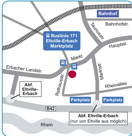
PSKB Erbach Markt 13, 65346 Eltville

Montags bis freitags bieten wir Beratungstermine nach Vereinbarung an.