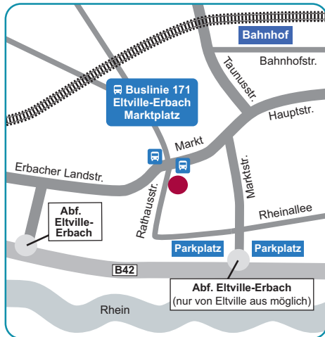
PSKB Erbach Markt 13, 65346 Eitville

Montags bis freitags bieten wir Beratungstermine nach Vereinbarung an.